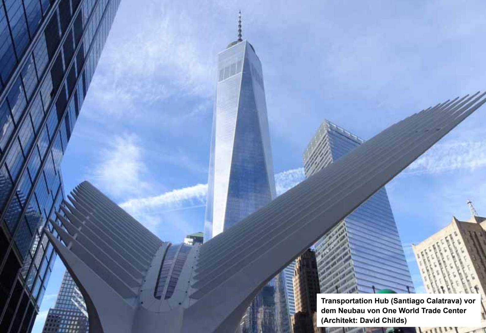
Transportation Hub (Santiago Calatrava) vor dem Neubau von One World Trade Center (Architekt: David Childs)